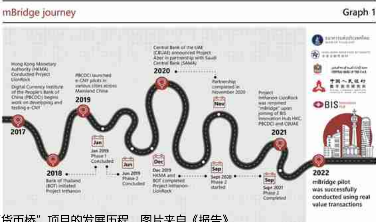
“货币桥”项目的发展历程。

10月26日，香港金融管理局联合国际清算银行（香港）创新中心、泰国中央银行、中国人民银行数字货币研究所，以及阿联酋中央银行，发布了《“货币桥”项目：通过央行数字货币(CBDC)连接各经济体》(Project mBridge: Connecting economies through CBDC)报告（下称《报告》），阐述了多边央行数字货币桥项目的试行成果。